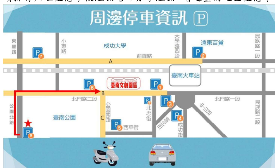
圖 1、臺南文化創意產業園區之周遭停車資訊

(五) 讓臺南地區學校認識臺美生態學校以及認證系統操作、經費申請說明，並邀請擁有辦理生態學校經驗老師分享經驗，增進臺南地區生態學校認證意願。