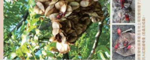
群聚的臺灣欖樹及在樹上吸取樹汁液的大紅斑椿象 (若蟲及成蟲)。

大紅斑椿象 Leptocoris abdominalis 大紅斑椿象是不見的椿象，成蟲與若蟲身體皆有一部，以成蟲過冬的冬天，其移動則移動較快速，如同螞蟓的爬已經，十分靈敏。