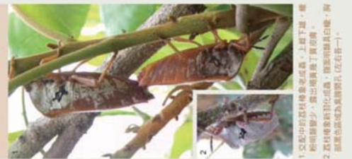
1. 交配中的荔枝椿象老成蟲，上層下層，雌則卵數少，露出雌側丁實皮膚。 2. 荔枝椿象卵孵化成蟲，腹中明顯具白條，胸側黑色區域為真體顏色 (左右各一)。

荔枝椿象 Tessaratoma papillosa 荔枝椿象的若蟲體色鮮紅，成蟲則為黃褐色。胸部則增加白色條紋，每隻有14顆卵，孵化成蟲於秋冬時常用尾端刺葉液而吸食葉子，在部分龍眼樹葉下棲息越冬。