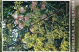
因有行連的臺灣欖樹可在十月時結滿紅色及黃綠色果實。