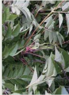
卵塊為幼蟲一出生即產下，有殼之蟲卵會因附著葉面而掉落。

5-6月適度修剪枝條(修剪量勿超過1/3)，特別是葉柄枝或萌蘗枝，但須注意勿過度修剪影響樹木生長及開花，且殘枝高量勿棄置原處，以免蟲量又移回。