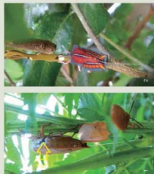
顏色、觸感、氣味、噴射的液體等，常使人們以為荔枝椿象的危險。 目前仍存於空氣中的荔枝椿象噴射液體對人無害，但可能引起皮膚瘙癢(但無害)。此時增加任何液體噴出(如：噴水、噴霧)均可能使更多人不受驚嚇而從現場逃出。 目前仍存於空氣中的荔枝椿象噴射液體對人無害，但可能引起皮膚瘙癢(但無害)。 目前仍存於空氣中的荔枝椿象噴射液體對人無害，但可能引起皮膚瘙癢(但無害)。 噴出的液體在葉片上凝結，吸引螞蟥取食(使葉片變黃)。