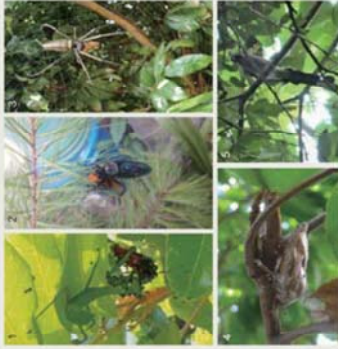
1. 樹蝸；2. 大斑捕食蠅虻(麗澤伴蜂蟻)；3. 平腹小蜂；4. 麗澤伴蜂蟻；5. 樹小蜂(寄生性天敵)。