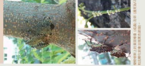
樹幹上的黃斑椿象 (成蟲) 產卵 (通常為12顆卵) 孵化後會出現黃色新蟲。

黃斑椿象 Ermesina fulva 黃斑相關的黃斑椿象亞種色澤，可巧妙地隱藏在枝幹上吸食樹液。黃斑椿象每次產12顆卵，觀察其排列組合以及卵孵化後的若蟲也具有「一卵一蟲」。