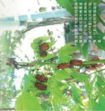
臺灣欖樹與含羞草荔枝椿象的分布，應與引進荔枝椿象寄主(的以含羞草)共同抵抗外來，可能導致其侵蝕性增加。

荔枝椿象 ( Tessaratoma papillosa ) 為荔枝及龍眼常見的害蟲，分佈於泰國、越南、寮國、香港及中國等地。1997年首次在全門發現，2008年前首次在台灣高溪發現，目前除臺東卑南地區外，花蓮零星分佈，已在臺灣各縣市地區普遍發生，其寄主植物主要為無患子科植物如含羞草、龍眼、無患子及臺灣欖樹 ( Koelreuteria henryi )。其中臺灣欖樹因為是本地特有種且花量豐碩美觀，近幾年普遍用作都市林地植栽及行道樹，使得荔枝椿象不僅為農業害蟲，由於其具液具有腐蝕性，如接觸人的皮膚，可能會造成腐蝕，經由媒體的報導，讓其在臺灣似乎有被當成都市害蟲的趨勢。目前荔枝椿象對於臺灣欖樹除可能造成部分嫩枝頂端嫩枝萎外，其他危害並不明顯，也未曾證實選擇任何寄主至臺灣欖樹。