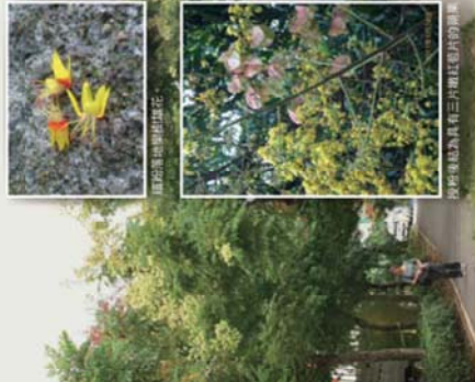
開花期的臺灣欖樹

臺灣欖樹是臺灣常見的行道樹，近年來種植的數量龐大，以臺北市為例根據2018年臺北市行道樹路燈資訊網 ( https://geopl.gov.taipei/ ) 至少有6,399株臺灣欖樹，佔總數量 (87,808株行道樹) 7.29%，在許多行政區幾乎是名列前茅。隨著時序變化，九月會開出黃色花序，盛花期地鋪成黃雲狀，中性花則經授粉後於十月開始結果，並且膨脹成氣囊狀如同紅色小燈籠般掛在樹梢，冬季時葉片由綠轉黃並逐漸凋零轉黃，可觀其蕭瑟之美。四季分別展現不同的色彩變化，因而有「臺灣雲南樹」、「煙籠樹」、「四色樹」等俗稱。