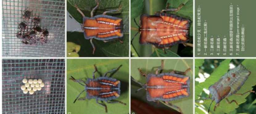
1. 卵 (黃色較少見，紅色較常見)。 2. 一齡若蟲 (二點紅點)。 3. 二齡若蟲。 4. 三齡若蟲。 5. 四齡若蟲。 6. 五齡若蟲 (尾端可抽出吸食器)。 7. 五齡若蟲 (尾端抽出吸食器) 孵化成白色成蟲。