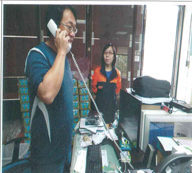
火災模擬演練— 通報全校師生避難及聯繫消防隊