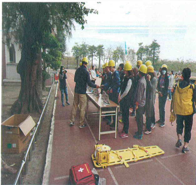
啟動學校緊急應變組織