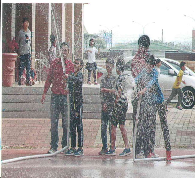
火災模擬演練—滅火體驗