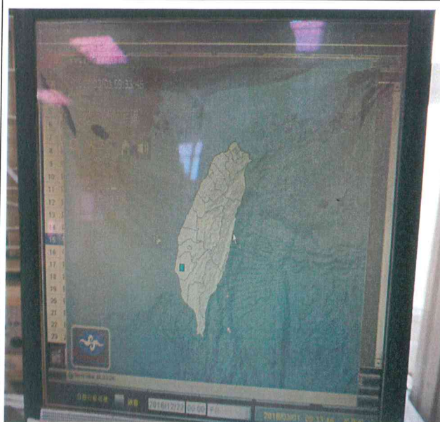
中央氣象局強震即時警報軟體