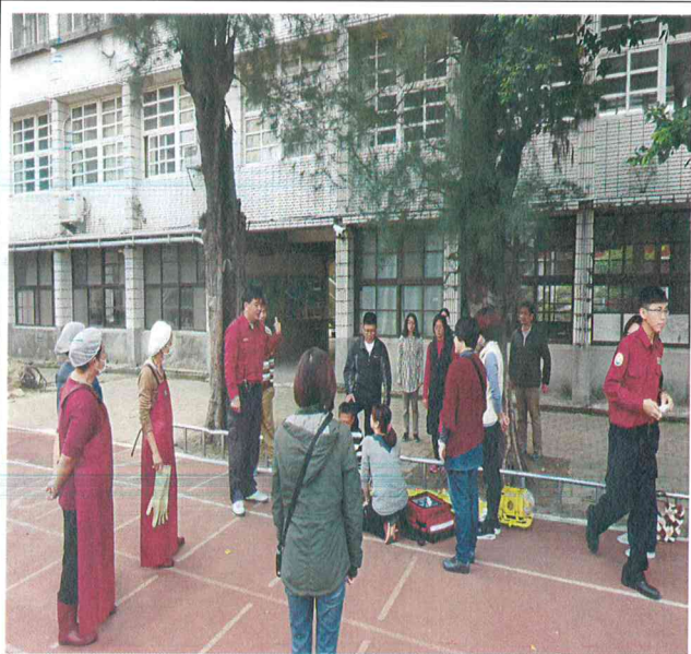
火災模擬演練—傷亡處理