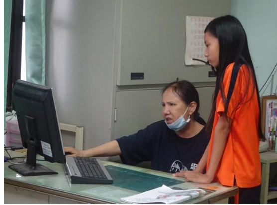
利用電腦輔導教學