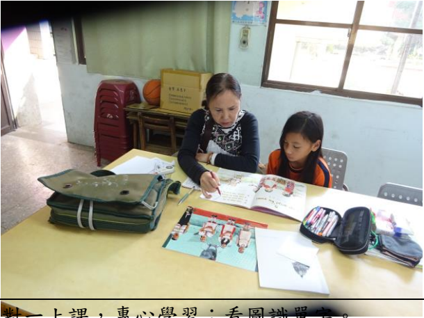
一對一上課，專心學習；看圖識單字。