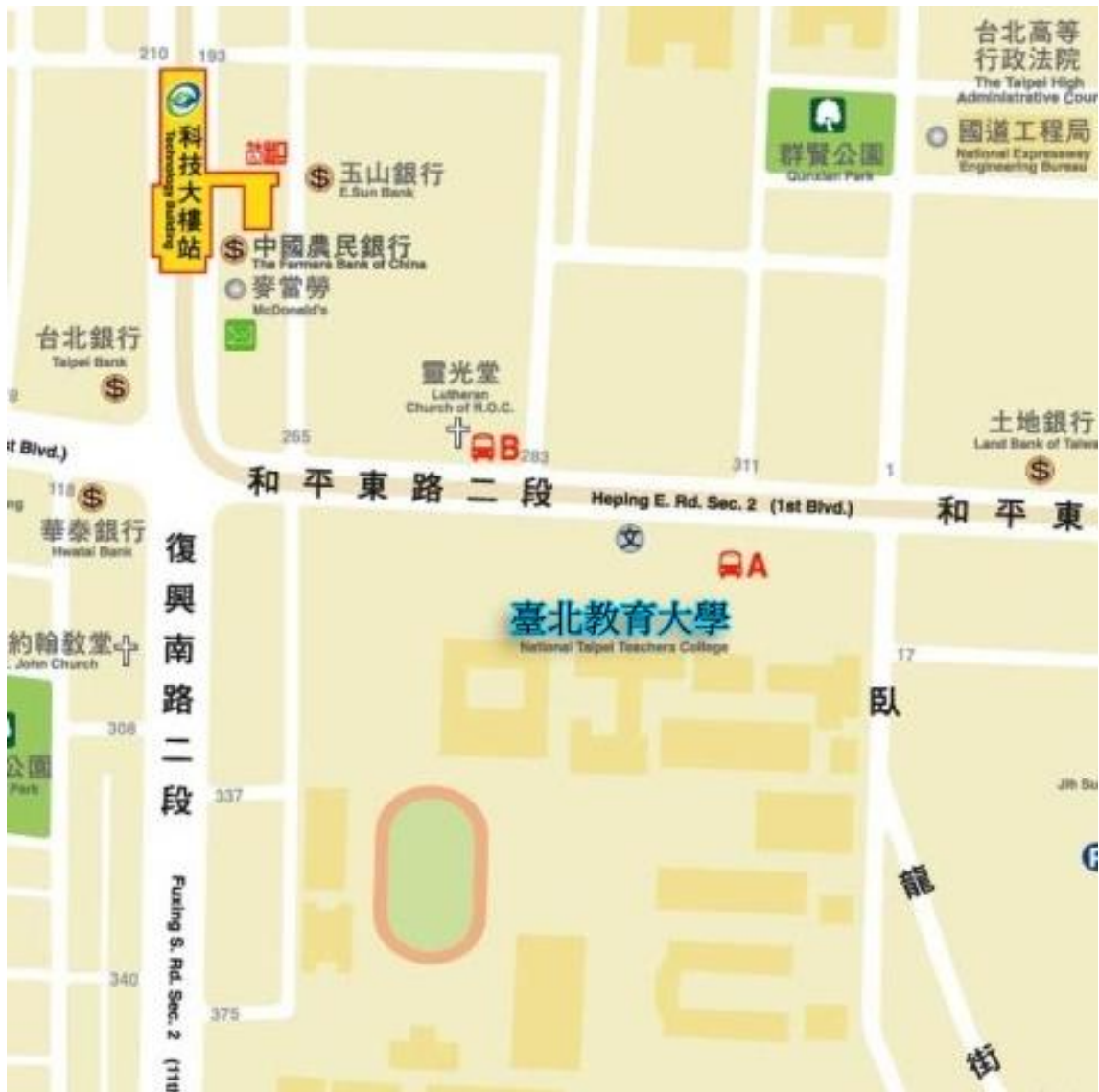
此地圖由國立臺北教育大學網站下載