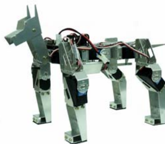
N Dog 機器狗