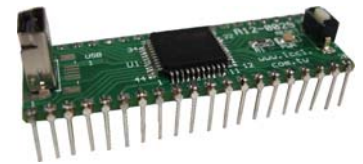
minIC 8051 開發板