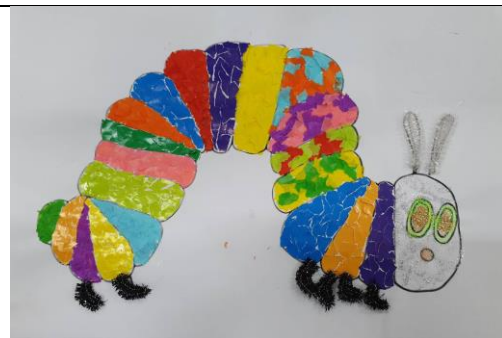
七彩繽紛的毛毛蟲