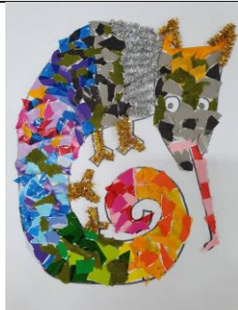
拼拼湊湊的變色龍