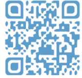
電子發票整合 服務平台