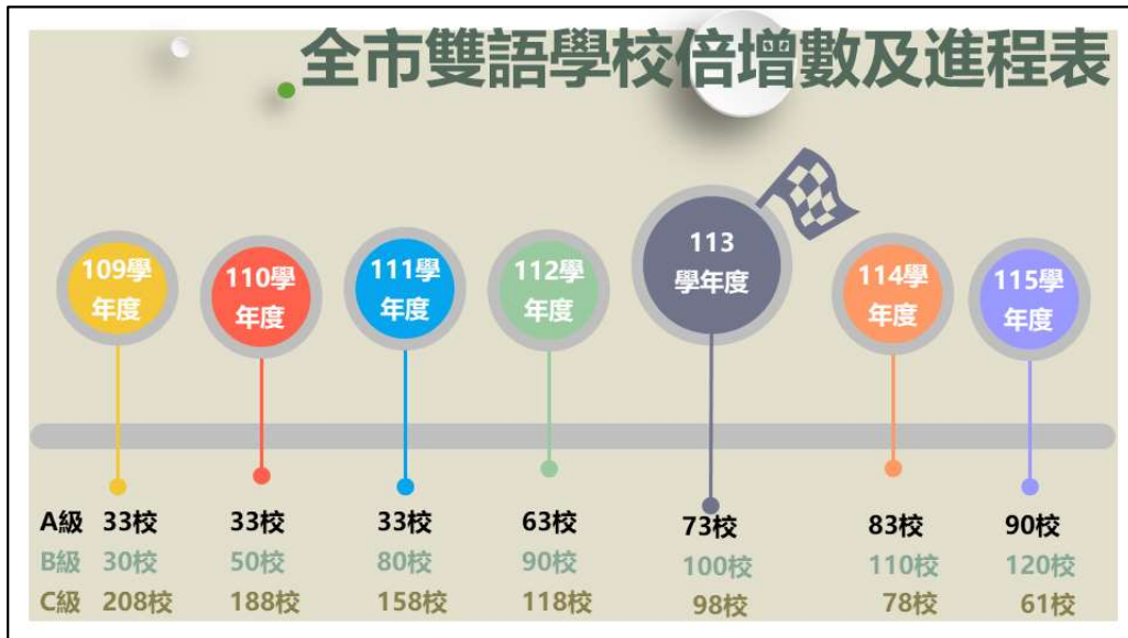
圖 3 臺南市雙語學校倍增數及進程表

為達校校雙語的推動目標，本局擬定雙語學校倍增計畫，明確訂定出每學年所預計推動核定的三類學校數，並藉此規劃與檢視雙語教育所需的相關資源與其實施成效。