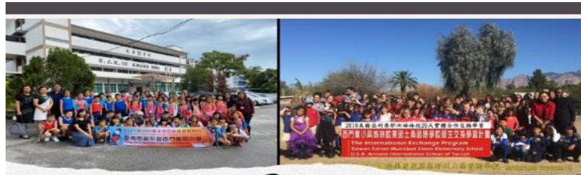
Study Tour in Malaysia