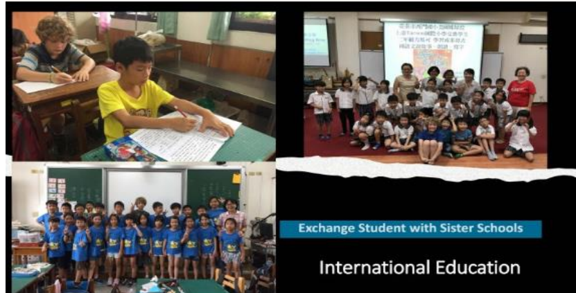
Exchange Student with Sister Schools