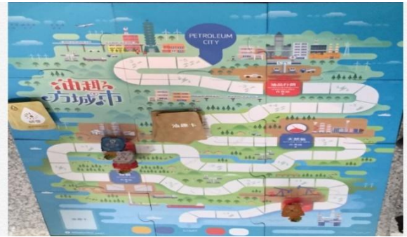
海洋減廢互動式宣導示意圖