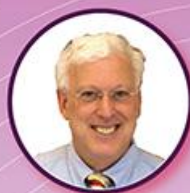
Prof. Robert J. Sternberg Cornell University, USA

Transformational Giftedness, and Why Our Conventional Definition of Giftedness Has Become a Disservice to Humanity