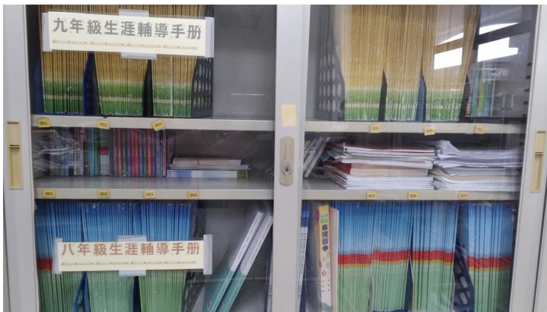
八、九年級生涯輔導記錄手冊

*檢核方式： 配合本校成績單發放時間進行填寫，並不定期於一些生涯探索活動、心理測驗後進行填寫。於每學期 3 月、9 月由導師先進行班級檢核後，再由輔導室檢核及核章。