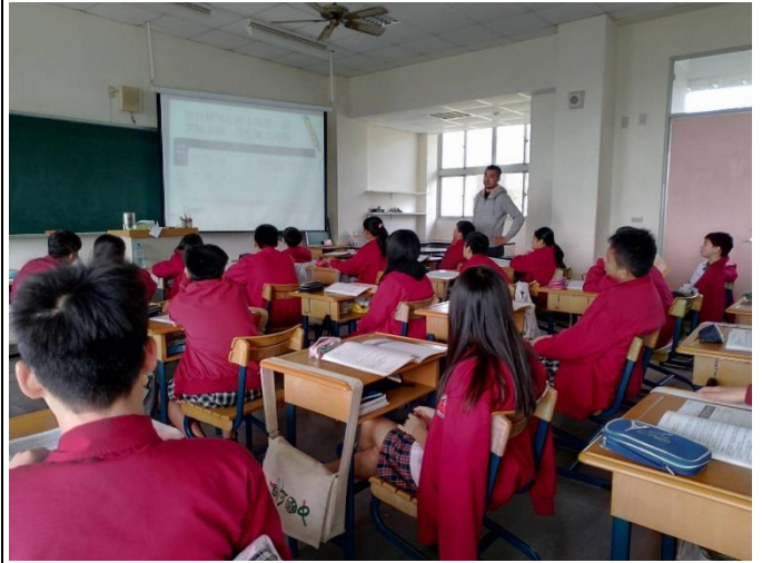
心理測驗結果解說