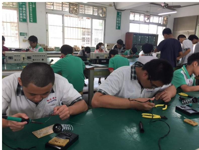
電機電子職群上課狀況，2017年10月6日電子銲接練習。 上課地點：白河商工電機科教室。