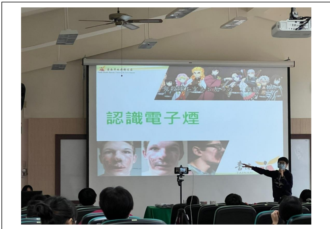
菸害防制宣導電子煙的危害