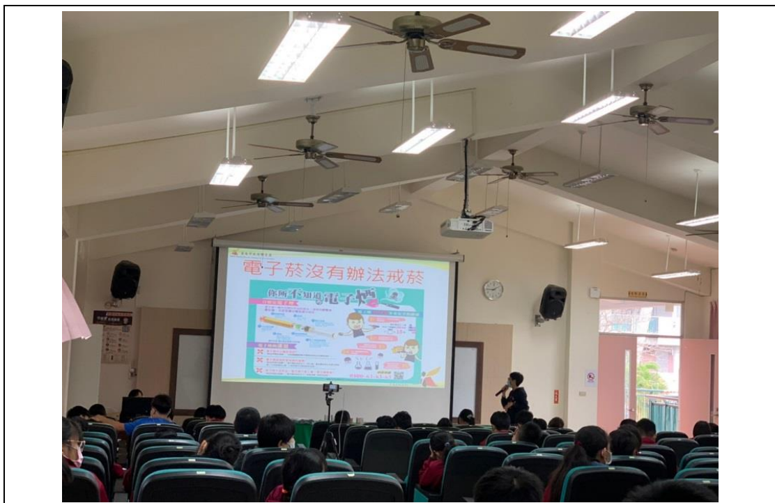
菸害防制宣導電子煙的危害