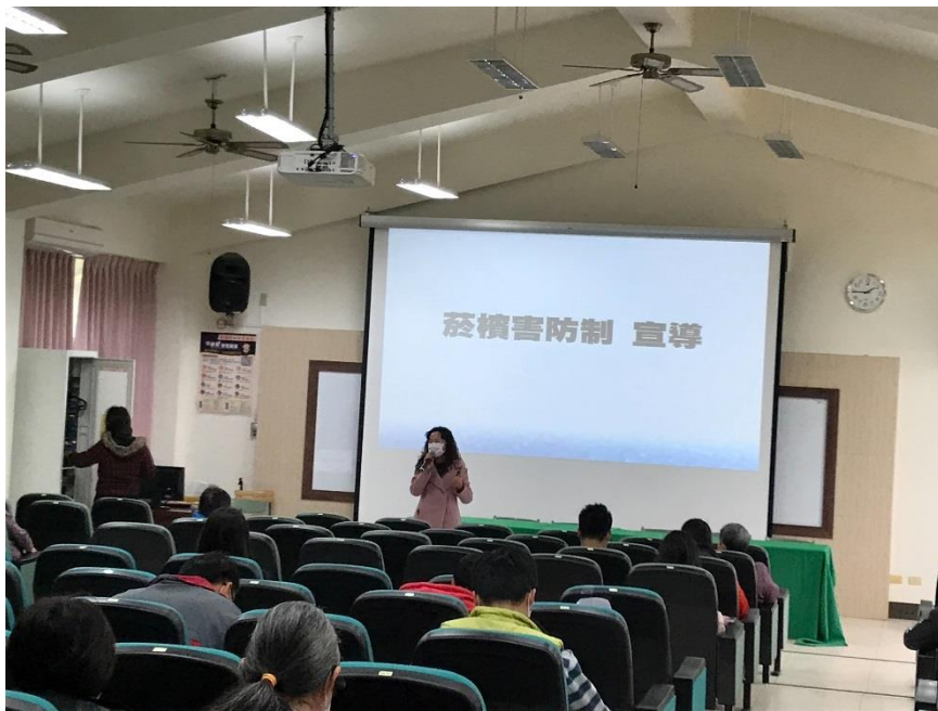
親師座談請家長關心子女抽菸問題