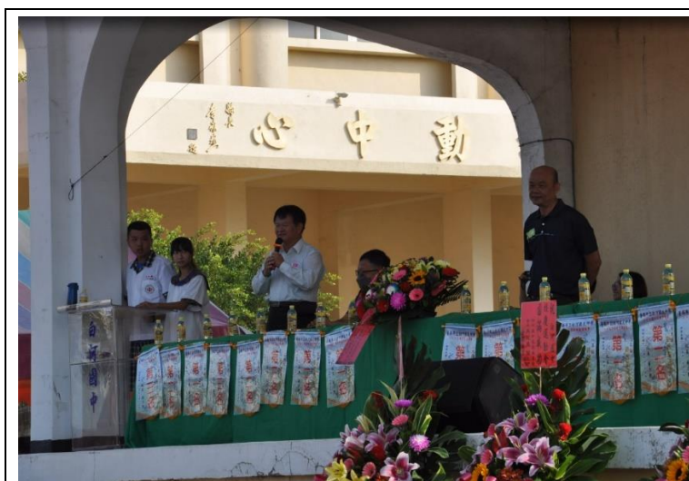
在校慶時文教基金會董事(社區人士)到場共襄盛舉