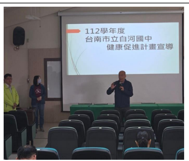
親職教育時也向家長及社區人士倡議健康的重要