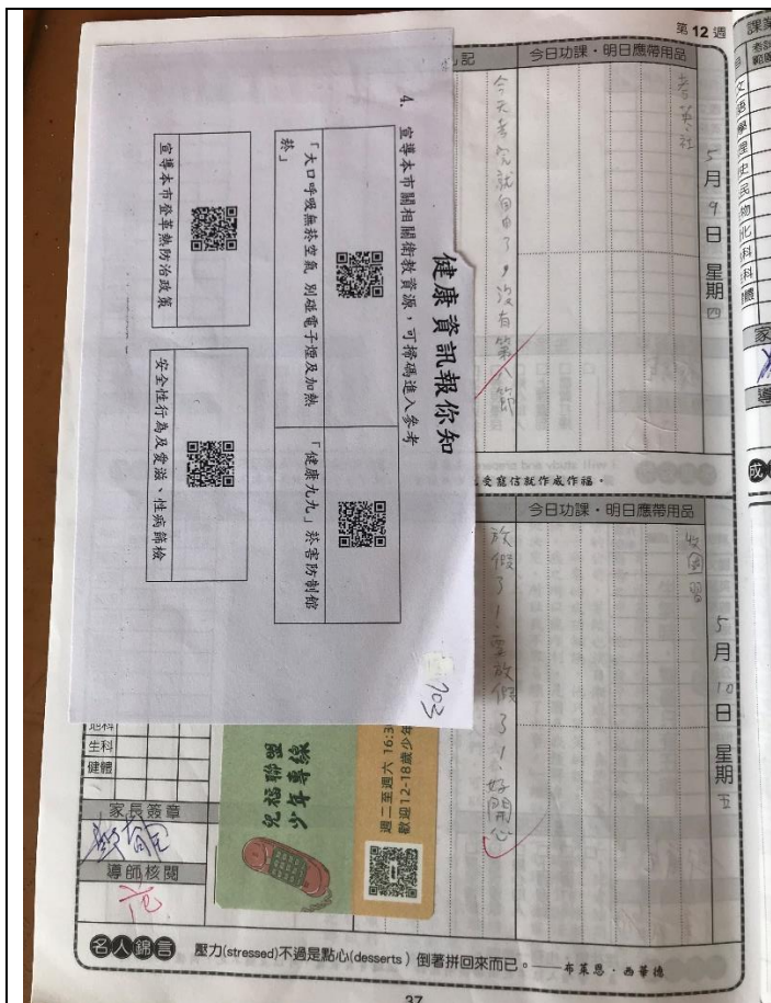
七年級同學在聯絡簿上貼健康資訊的 QR Code