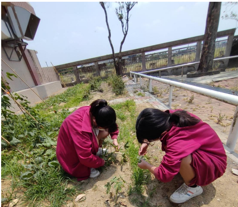
說明：學生參與校園綠化