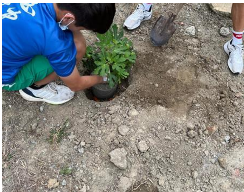
說明：學生參與校園綠化