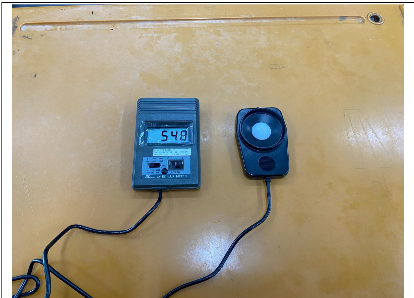
說明：學生桌面照度