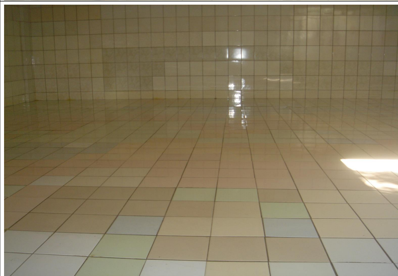
說明：清洗地下水塔。