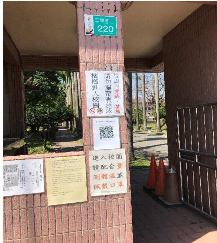
說明：校門口禁菸檳標誌