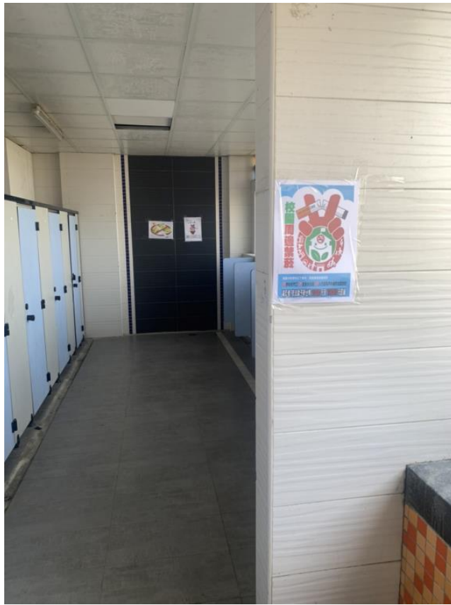
說明：男生廁所拒菸檳宣導標語