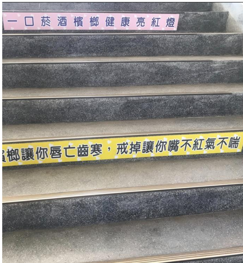
說明：樓梯拒菸檳宣導標語