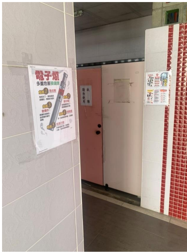
說明：女生廁所拒菸檳宣導標語