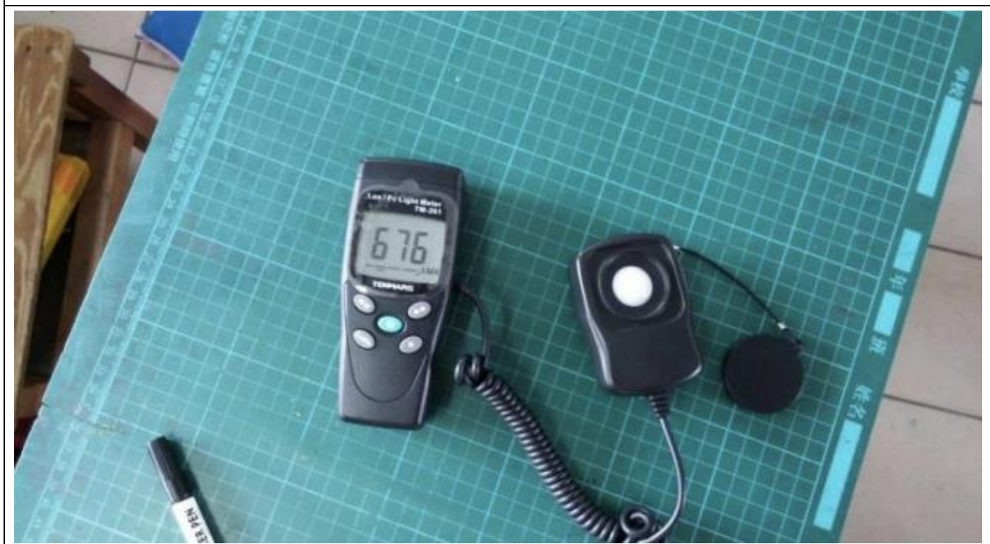
說明：學生課桌椅照度