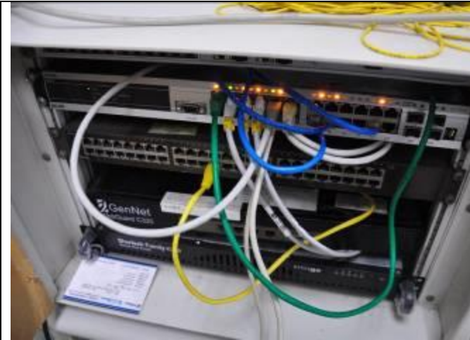
一、主要機房網路設備