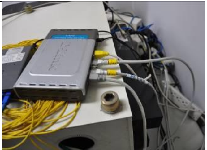
六、各個連接點皆有設定編號