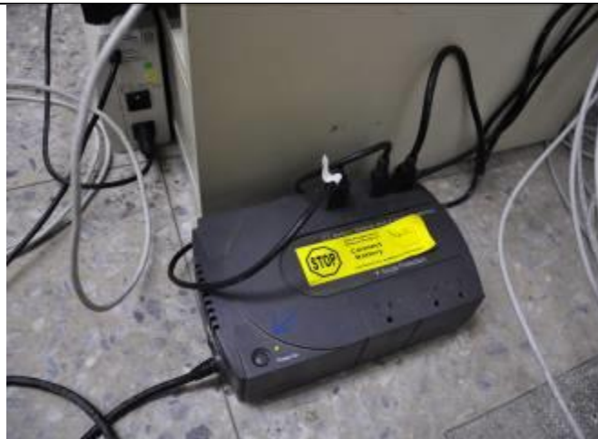
五、設置不斷電系統，維持主機穩定運作