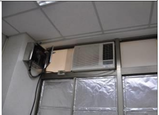
四、設有自動啟動器，兩台冷氣交替運作