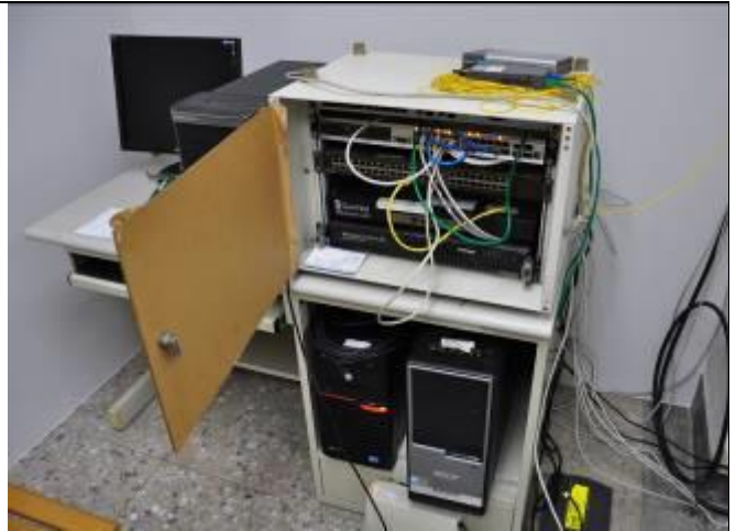
二、相關設備皆貼有財產標籤以及相關訊息