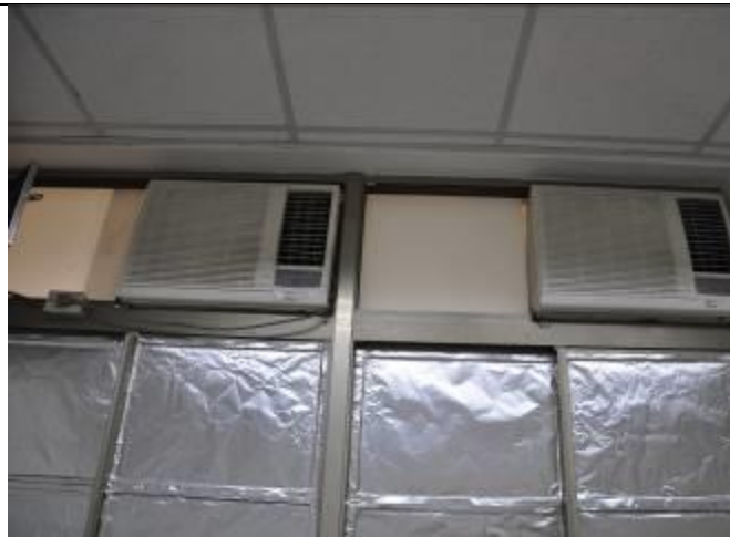
三、機房有設置兩台冷氣