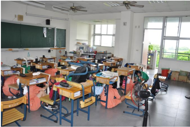
師生趴下、掩護、穩住