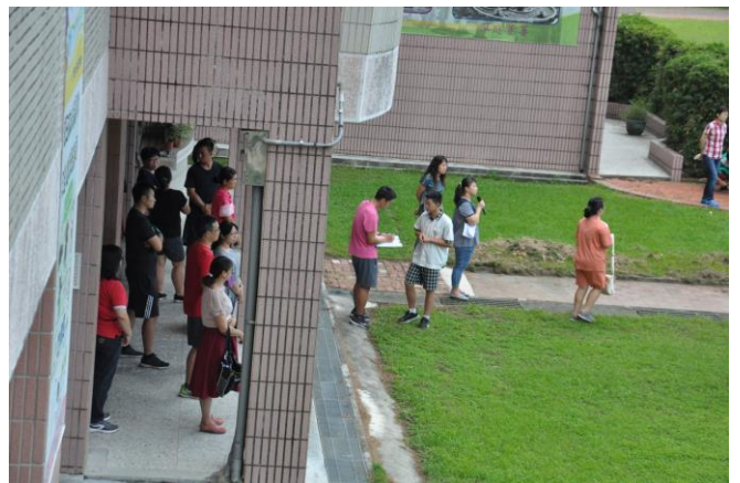
清點並回報名班人數