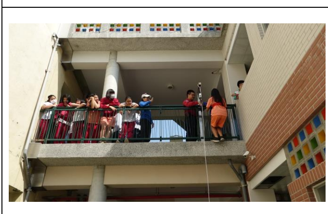
火災逃生模擬演練