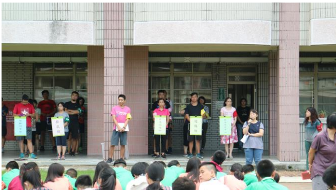
啟動學校緊急應變組織