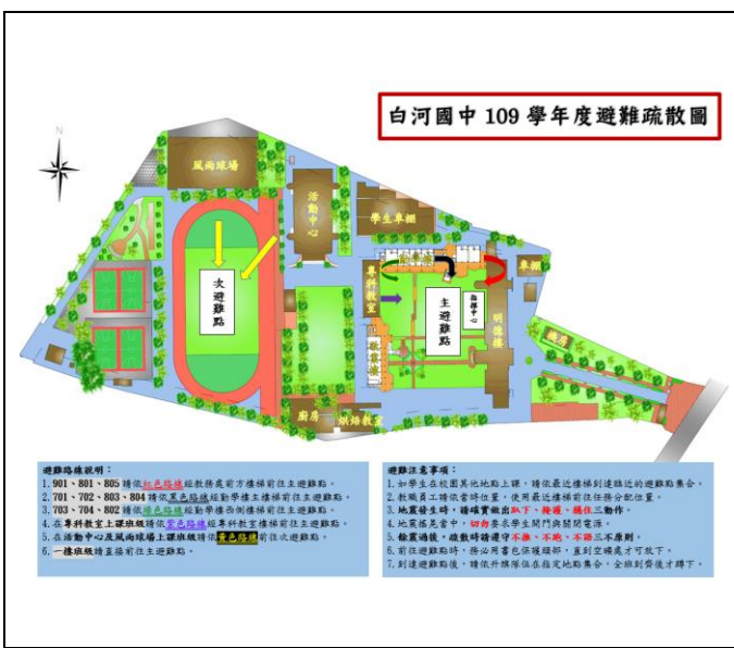
校園防災避難地圖