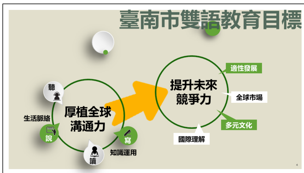
圖 1 臺南市雙語教育目標

面對未來更密切的全球化互動與顯著的全球公民責任，學生未來競爭力的內涵不僅應關照全球市場、多元文化與國際社會的理解，以培養學生具備全球性的視野與國際移動力，才能讓學生因應更複雜、更具不確定的未來挑戰。