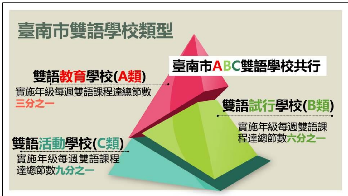
圖 2 臺南市雙語學校類型圖

積極落實「教育機會均等」為本市各項教育政策重要原則，本市規劃各類型學校有不同的雙語課程發展重點，以達到「校校雙語、適校發展」的政策目標。因應各校課程發展的特色與需求，分別規劃不同的雙語教育目標、課程重點與實施節數，以訂定三種雙語學校的類型。