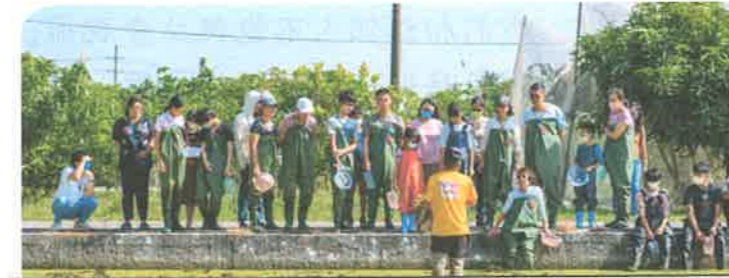
2023 年兒童生活寫作獎助頒獎活動後，基金會邀請參與的師生一起換上青蛙裝，在官田的菱角田體驗菱角採收的工作。