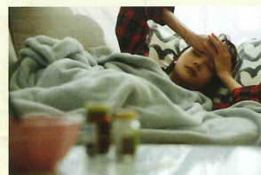
社區弱勢兒童/青少年