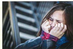
一般預防性青少年