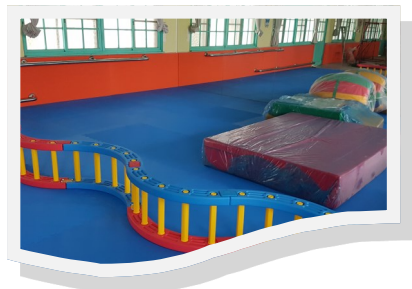
墊上運動及體適能運動區

對於樂活運動站，每一個同學都相當的期待，一直在詢問什麼時候可以到樂活運動站裡面去玩。可見樂活運動站對學生的吸引力。