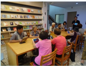
樂齡教室利用平板進行線上閱讀教學