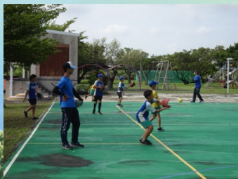
Teeball 球隊假日集訓為9月份全市賽準備