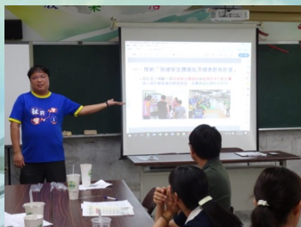
正向輔導管教宣導