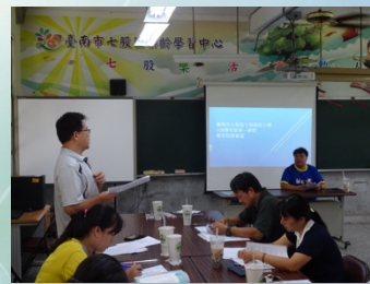
108 學年度第一學期期初校務會議