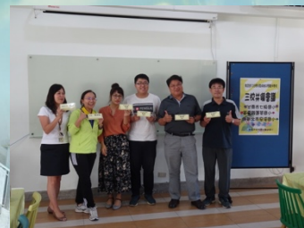
108 學年度城鄉共學夥伴學校共識會議