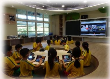
與他校進行分組合作