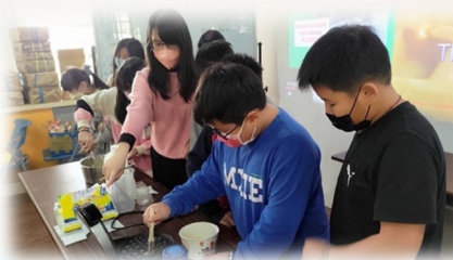
同學一起體驗異國美食製作