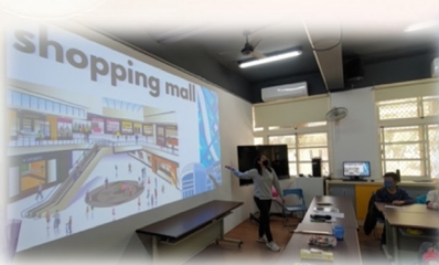
瞭解每個場域的英文