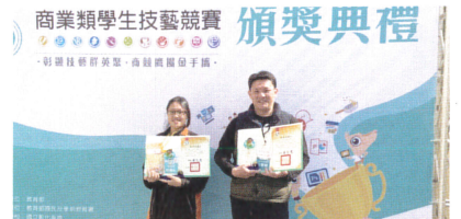
商業類科技藝競賽金手獎