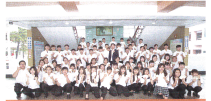
4張以上證照達人合照