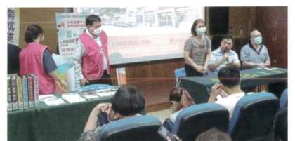
進修部學生媒合就業