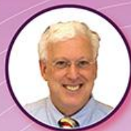
Prof. Robert J. Sternberg Cornell University, USA

Transformational Giftedness, and Why Our Conventional Definition of Giftedness Has Become a Disservice to Humanity