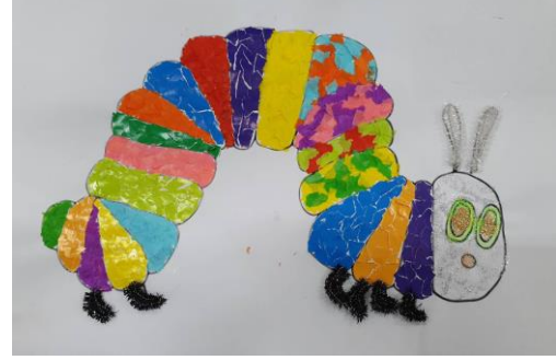
七彩繽紛的毛毛蟲