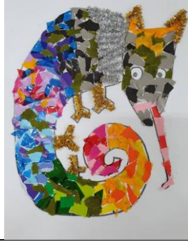
拼拼湊湊的變色龍