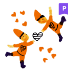
心疫苗-讓小人人陪你吧!