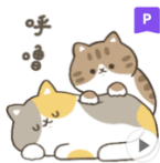
心疫苗-喵葫蘆愛呼嚕

心疫苗貼圖為中華心理衛生協會心防疫工作小組為推廣心理防疫、心理健康促進的理念及行動，便利大眾於日常生活中表達關心、支持與同理於友群中，感謝辛苦防疫及協助共度難關的各方人員，並強化安心連結，邀請五位繪師發揮各自的特色，精心創作五組「心疫苗 LINE 貼圖」，參與全民心理防疫的行動。