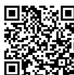
游於藝網站使用說明影片