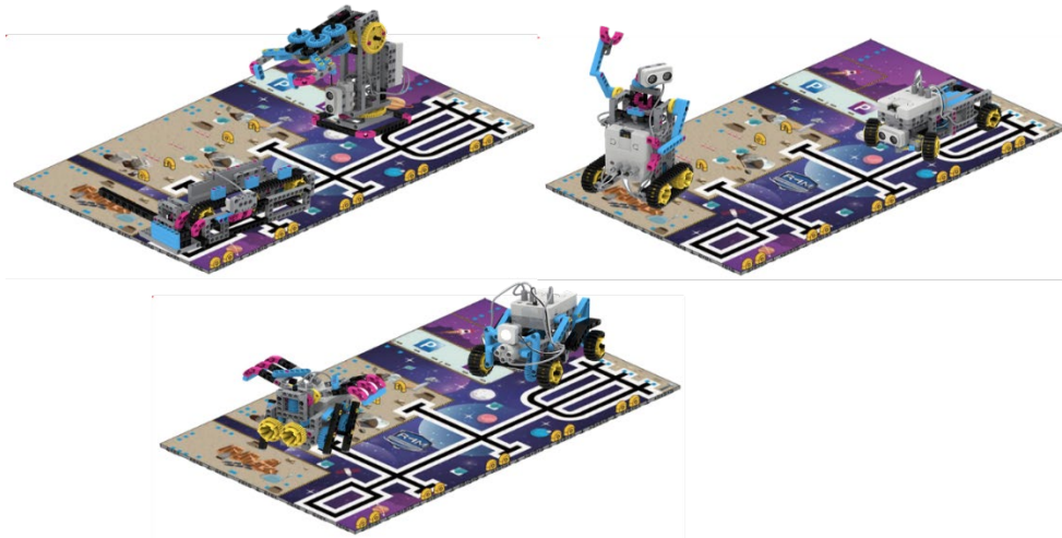
(圖 2)太空任務模組示意圖