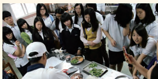
韓國外食科學高等學校廚藝交流