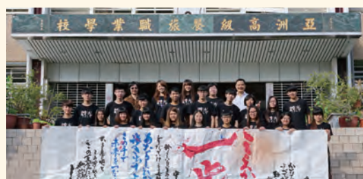
日本學校贈送國際教育旅行回禮