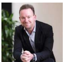
Geoff Mulgan (英國)

知名永續與仿生系統設計與創新家，英國皇家文藝學會(Royal Society of Arts)與國際未來論壇(International Futures Forum)成員，伊比利亞仿生科技(Biomimicry Iberia)共同創辦人，曾任教於聯合國訓練研究所(UNITAR)共同推動的「蓋婭教育(Gaia Education)」計畫。其著作《設計重生文化(Designing Regenerative Cultures)》是未來學與永續社會發展的經典之一，被聯合國氣候變遷委員會時任主席Christina Figuerers譽為生態危機最重要的論述之一。