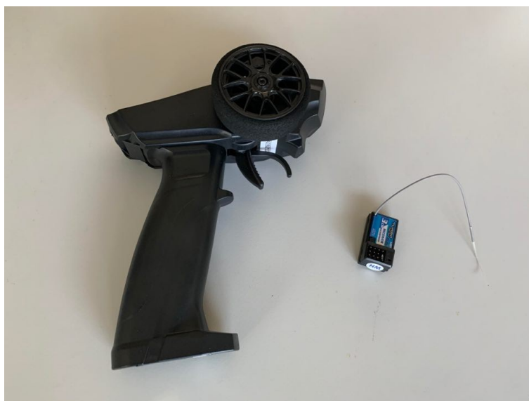
市售 3 通道 2.4GHz 槍型遙控收發器

本競賽禁止使用市售 2 通道、3 通道或多通道之 2.4GHz、27MHz (或其他頻率) 槍型或板型遙控收發器 (或由類似控制元件組合) 作為控制遙控帆船之裝置 (如下二圖所示)，違者以 失格 認定。