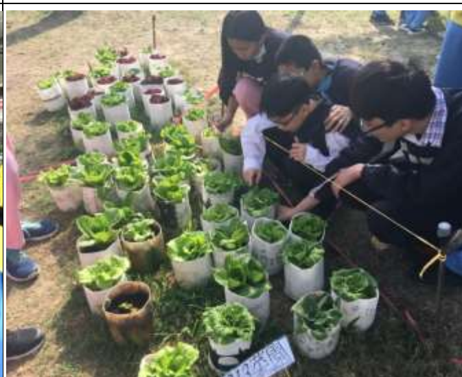
學校規劃菜園 讓同學進行食農活動