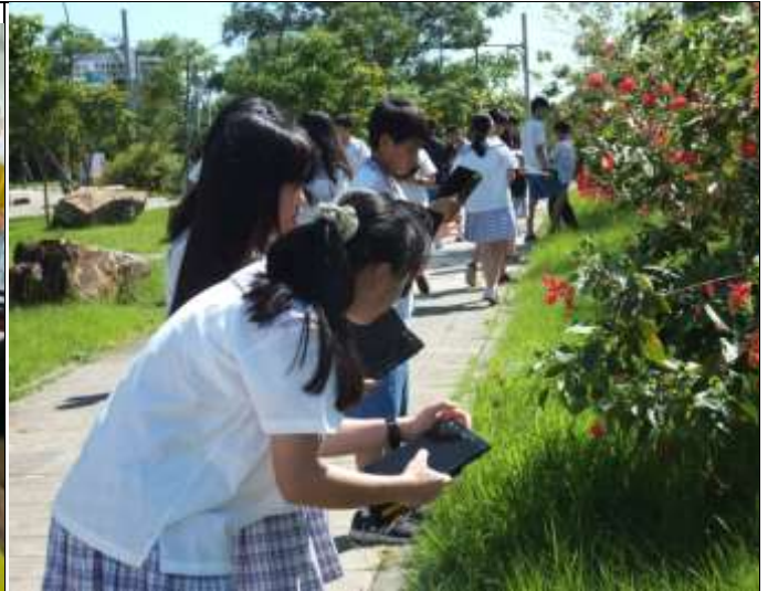
利用平板紀錄巴克禮公園生態