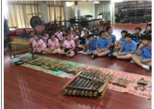
多元文化體驗-印尼音樂