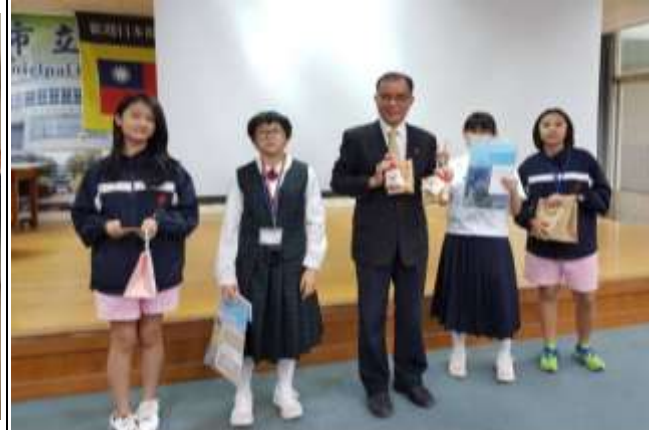
校長與同學合照留影