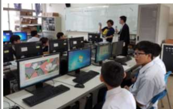
日本同學參與本校資訊課程