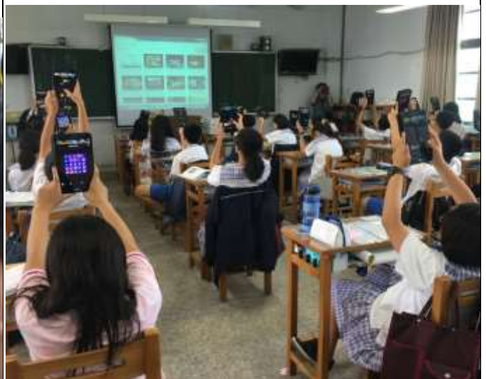
同學利用平板進行上課