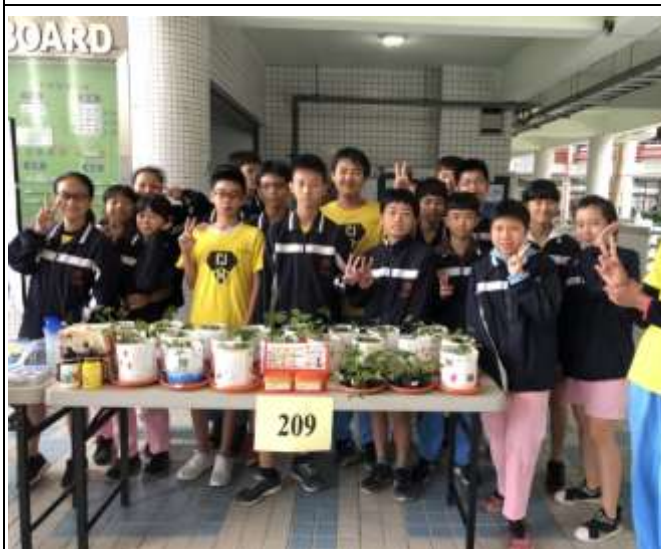
同學將種植的盆菜 進行聖誕節活動愛心義賣