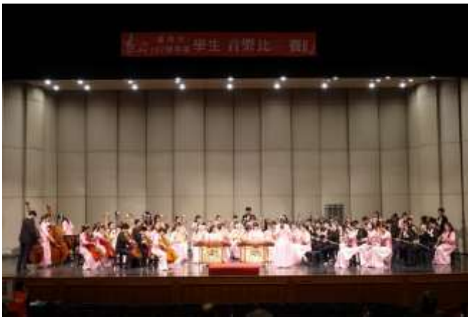
音樂比賽國樂合奏特優第一名