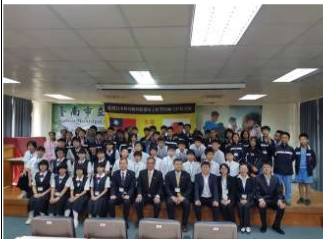
2018 日本水上町師生來訪

本校致力於國際交流發展，每年均有外國師生來訪互動，拓展學生國際視野與英語口說能力