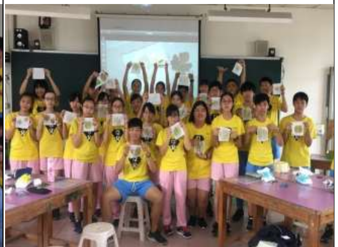
美感藝術特色課程-植物之美