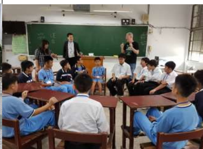
日本同學參與雙語社團活動