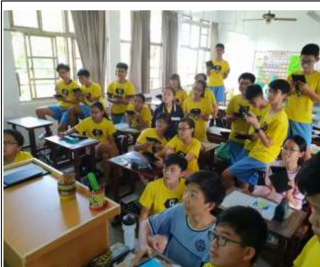
利用平板進行 kahoo 搶答

本校參加〈行動學習計畫〉，教學結合平板設備 激發學習興趣(自然領域及綜合領域教學結合行動學習)