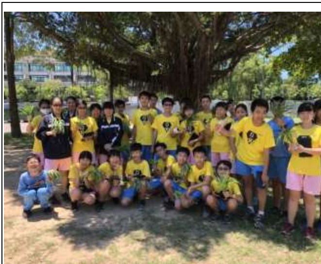
綜合領域家政活動-收割作物