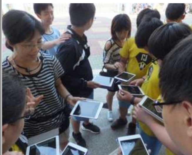
利用平板結合家政採買活動