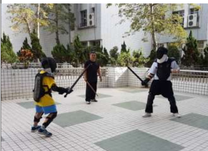
日本同學參與劍道社活動