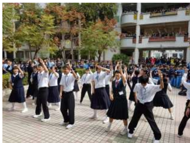
日本師生表演健康操