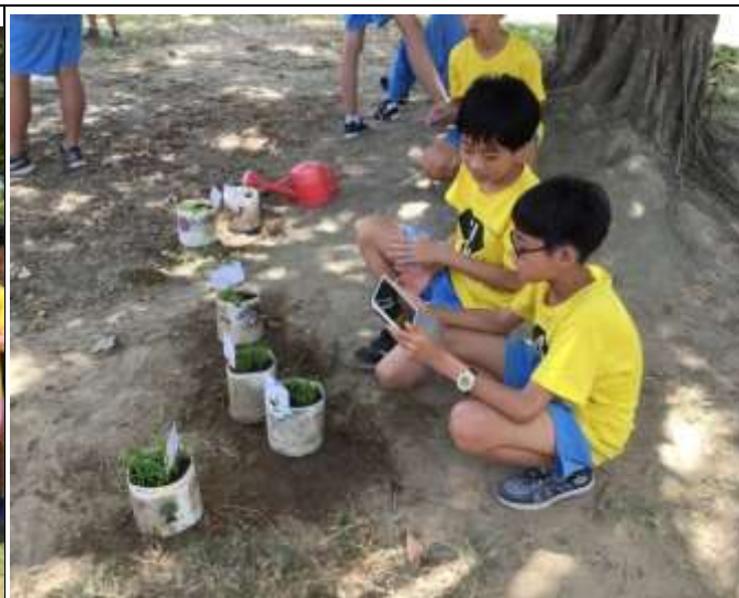
同學用平板紀錄植物生長