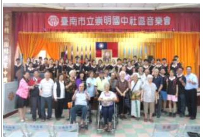
榮民之家社區關懷音樂會