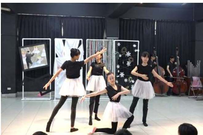
名畫動起來-寶加與芭蕾舞音樂劇