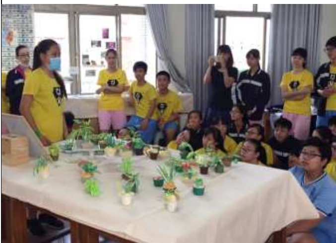
藝術家駐校課程-盆栽杯子蛋糕