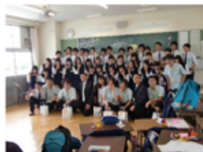
兩國同學們親密地合照留念