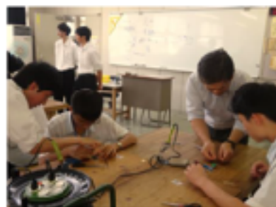
製造 LED 燈