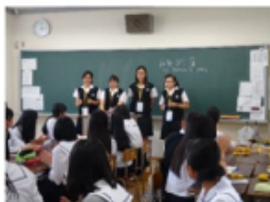
參與容易理解的課業