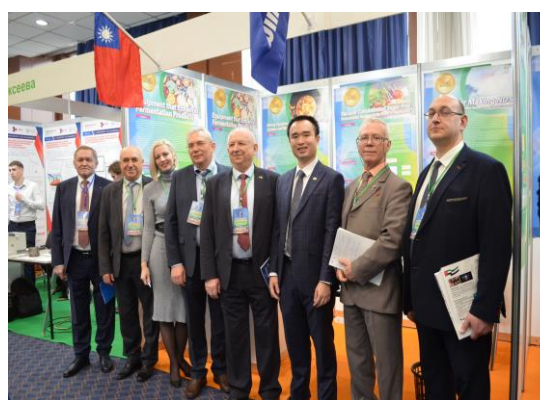
▲ 當地廠商蒞臨台灣展區洽談合作