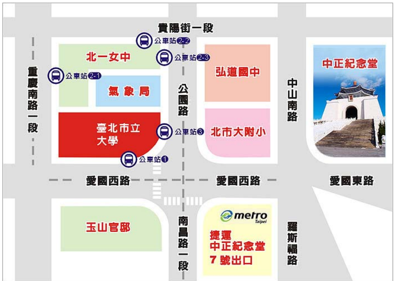
臺北市立大學（臺北市中正區愛國西路1號）