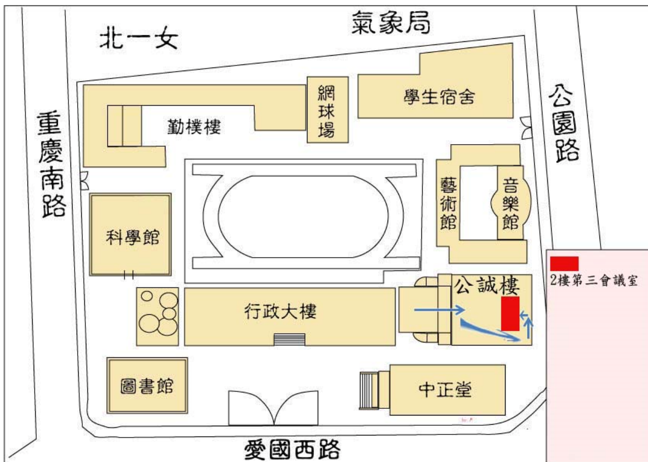
臺北市立大學校園示意圖