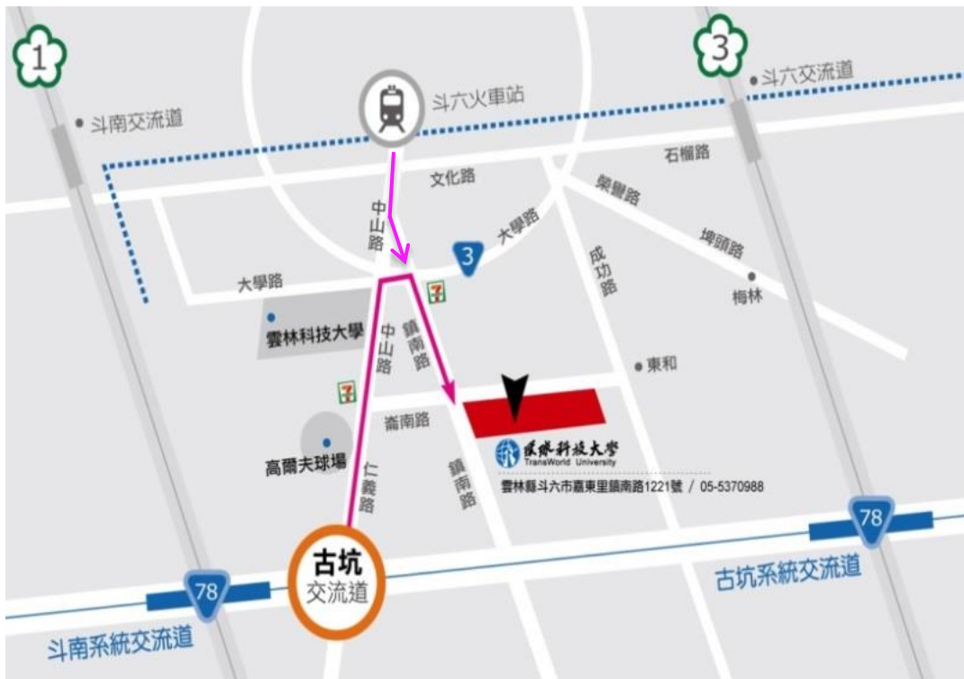
圖 2 環球科技大學位置圖