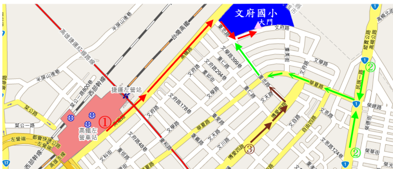
圖 4 文府國小位置圖