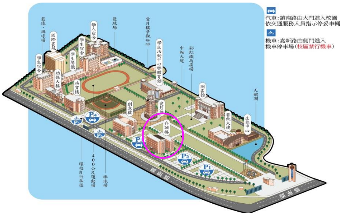
圖 3 環球科技大學校內示意圖