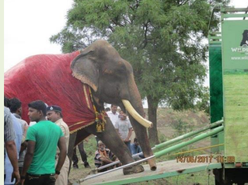
上圖：Gajraj 被鍊乞討受虐 51 年