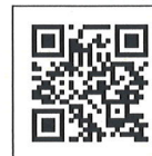
法務部 「More法狀元」宣導網