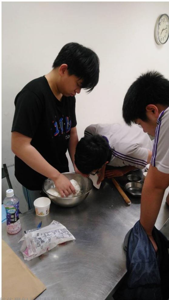
建興國中實用技能學程及技藝學程簡介