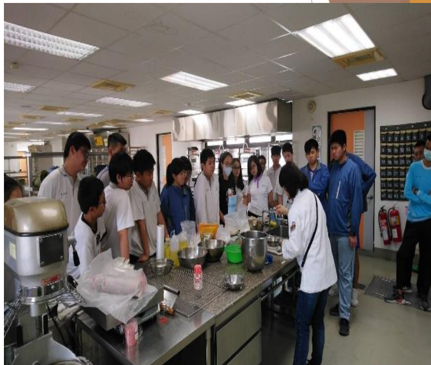
南英商工老師指導