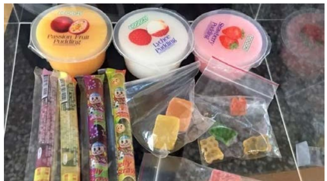
假糖果真毒品，中小學反毒策展震撼 親子天下 https://www.parenting.com.tw/article/5072351