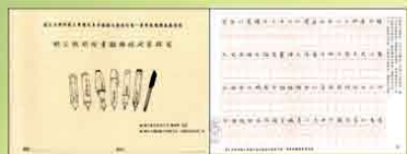
楷書(3) 明文徵明楷書離騷經