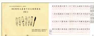
楷書(4) 隋智永真書千字文