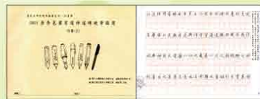
行書(3) 唐李邕葉有道神道碑