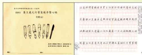
行書(4) 集王羲之行書聖教序暨心經

【參考資料】見-麋研齋網站： http://midabook.theweb.tw