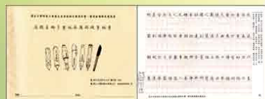
楷書(2) 唐顏真卿多寶塔感應碑