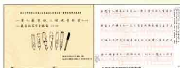
行書(1) 唐人蘭亭敘三種硬筆臨寫