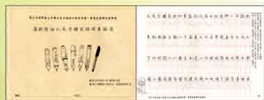
楷書(1) 唐歐陽詢九成宮醴泉銘