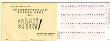
楷書(5) 元趙孟頫玄妙觀重修三門記暨仇鏐墓碑銘