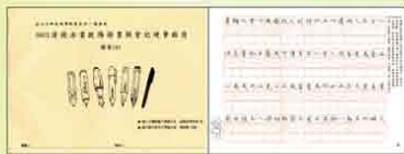
楷書(6) 清錢泳書歐陽脩畫錦堂記