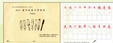
行書(6) 蘭亭敘簽字筆臨寫