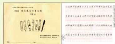
行書(5) 集王羲之行書心經(含簽字筆臨寫)