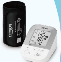
藍牙電子血壓計3名