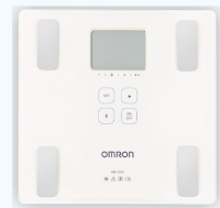
藍牙體重體脂計3名