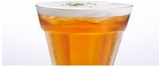
冰紅茶 杯器皿 可林杯/吧叉匙/沖茶器/雪平鍋/量酒器/搖酒器/沖壺 材料 6 公克紅茶茶葉 30ml 果糖