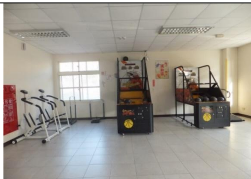
一樓設有籃球機、健身器材