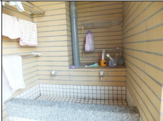
寢室設有洗衣台及曬衣空間