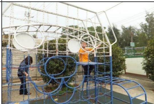
宿舍外有籃球場及遊樂設施

●需住宿者請連同報名表與住宿申請表一併傳真 04-25565639 至臺中市立啟明學校 謝秘書 收