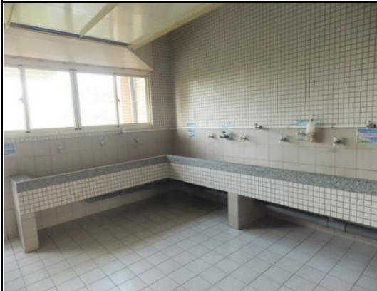
公共區設有洗衣空間和脫水機