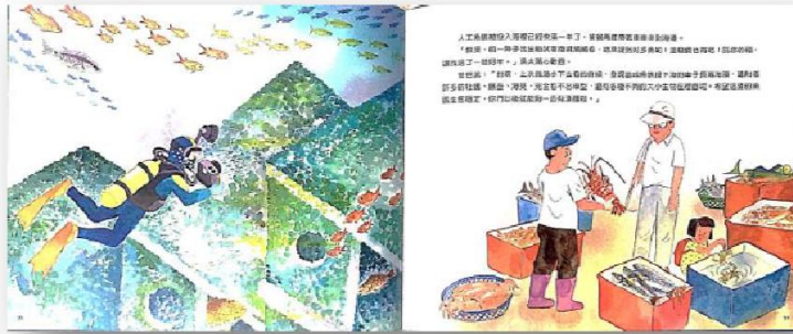
— 範例作品引用自：爸爸是海洋魚類生態學家・張東君 —